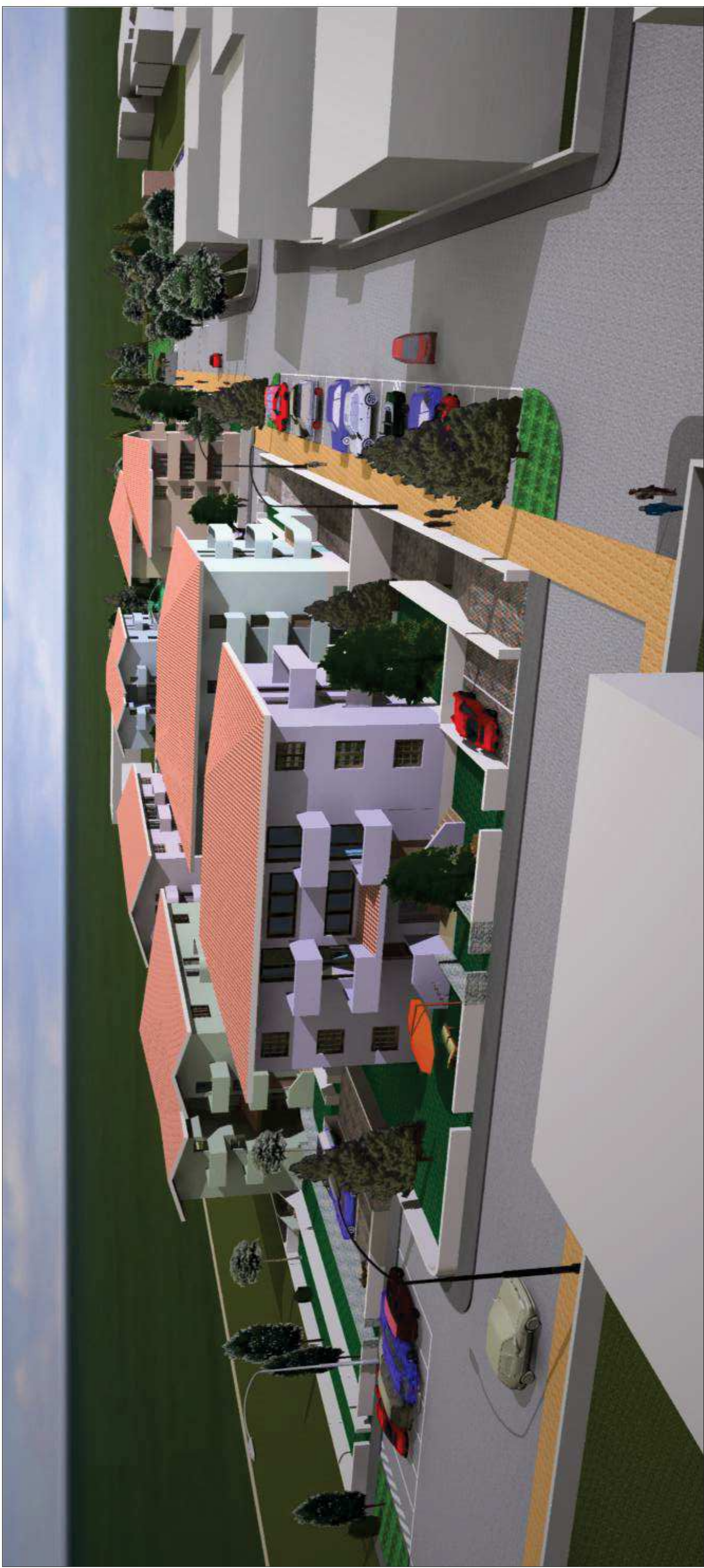
VISTA N. 4 - DA VIA CATTANEO