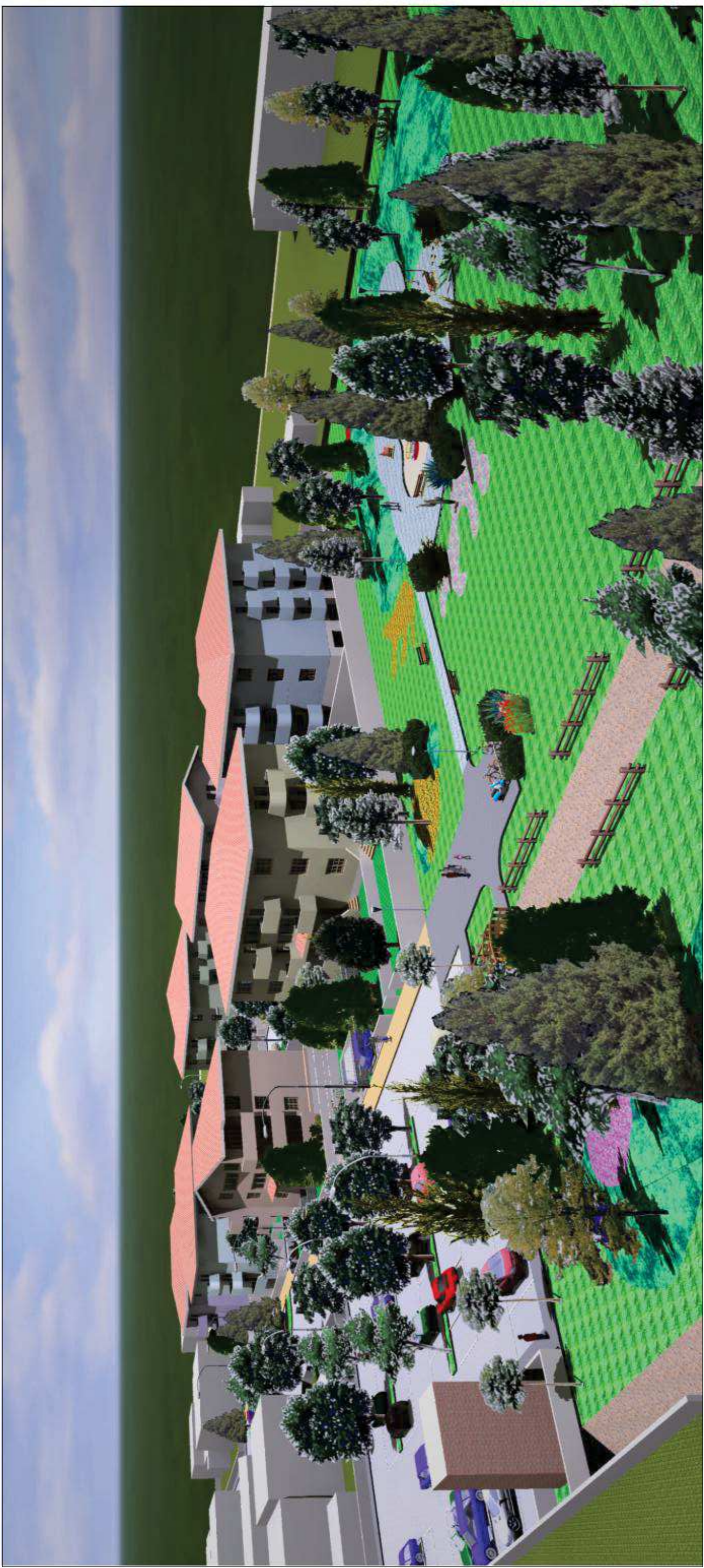
VISTA N. 6 - DAL PARCO SUD