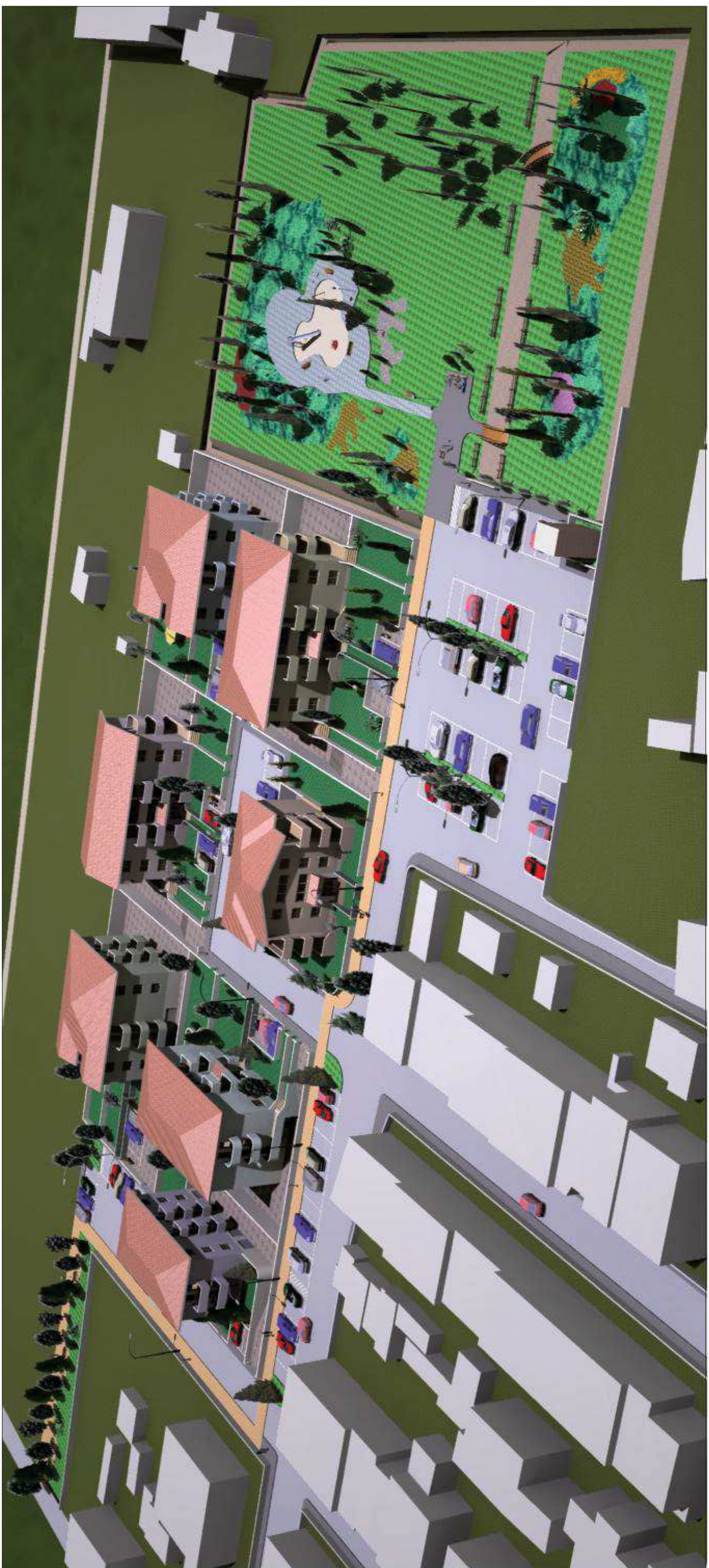
VISTA N. 2 - A VOLO D'UCCELLO