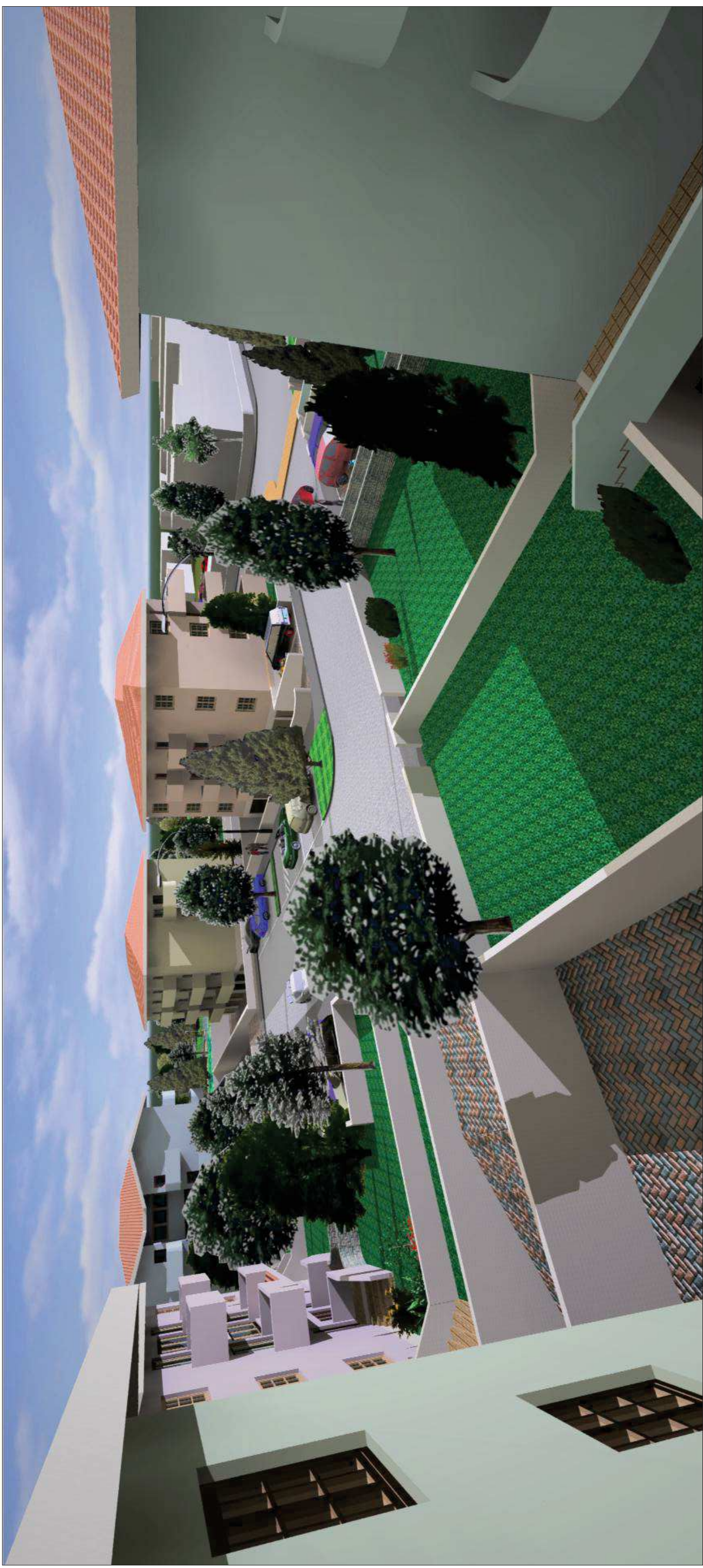
VISTA N. 3 - DALA ROTATORIA INTERNA