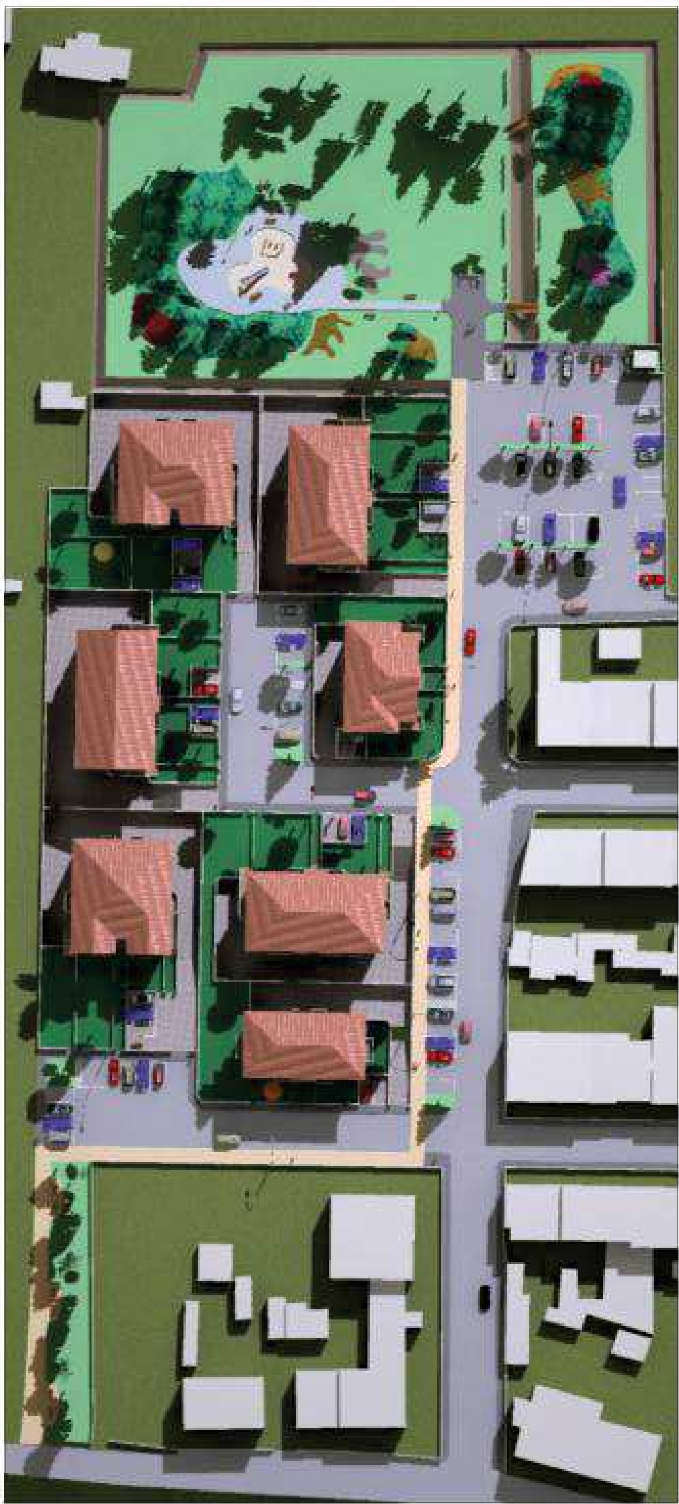
VISTA N. 1 - DALLO ZENIT