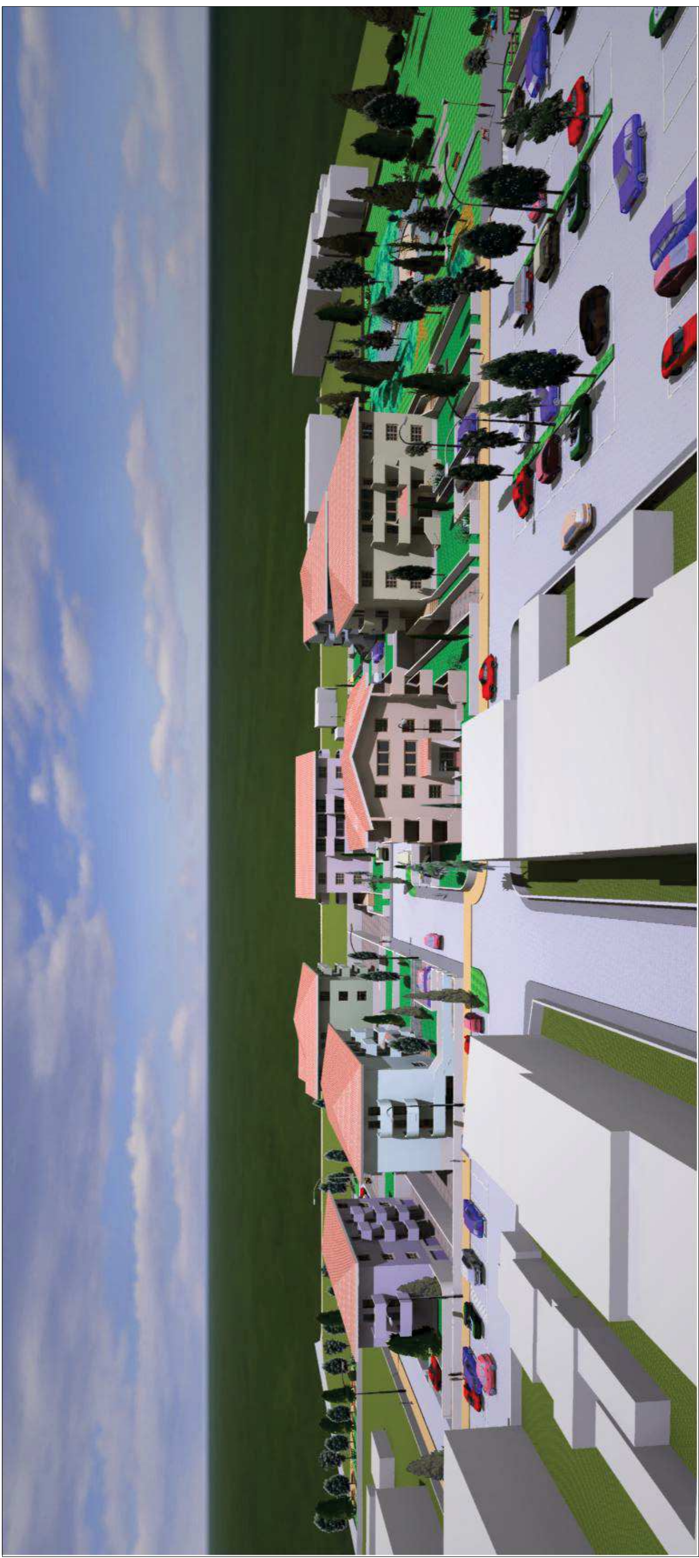
VISTA N. 5 - DA VIA MONTANELLI