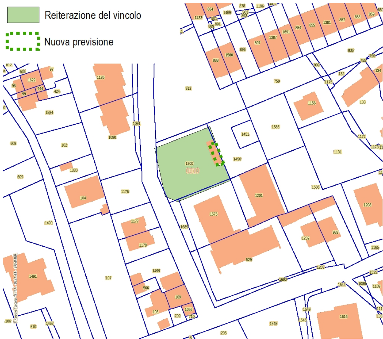
Estratto Catasto