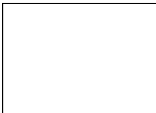
Fig. 2 – Vincoli paesaggistici (Geoscopia)