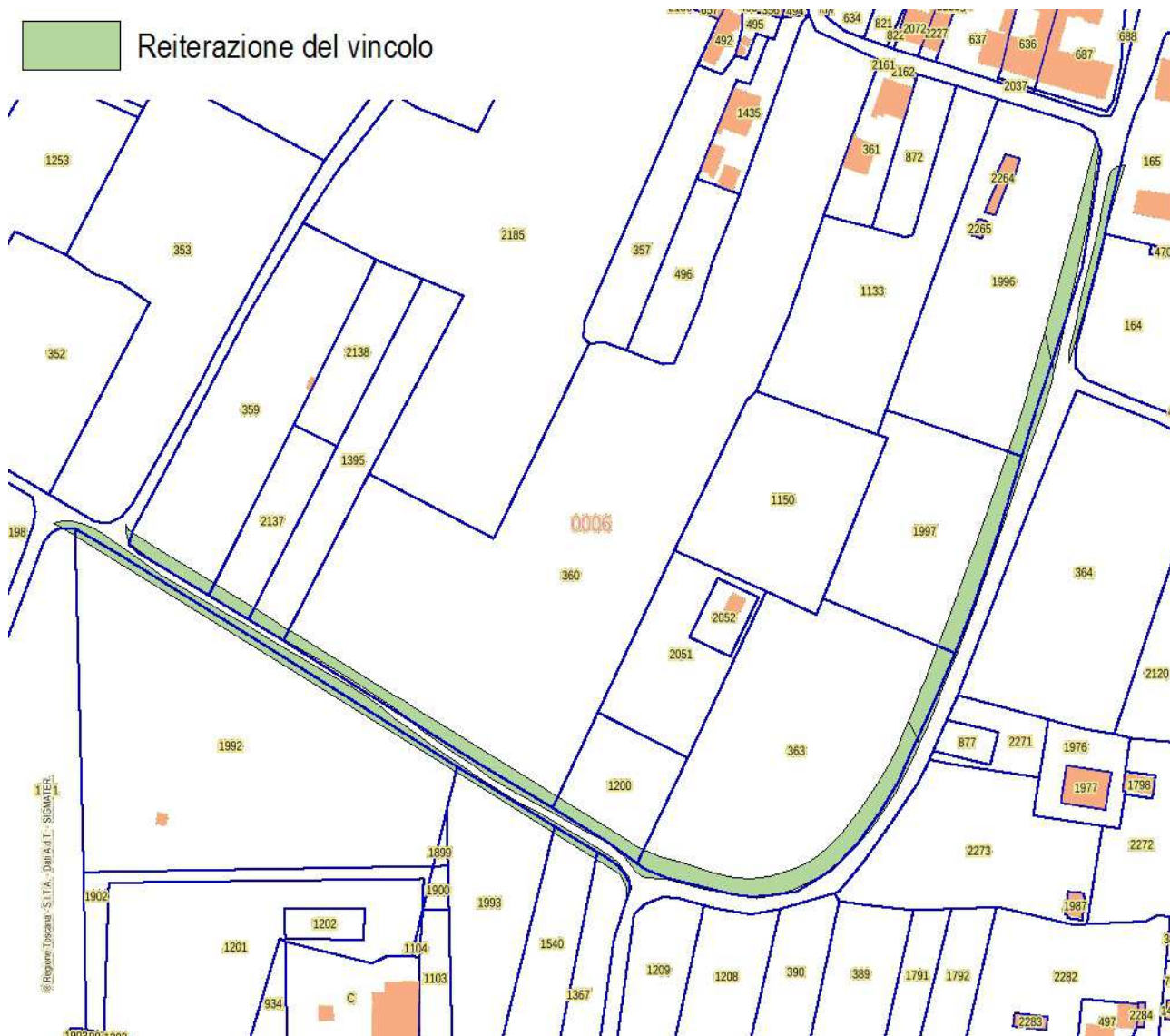
Estratto Catasto