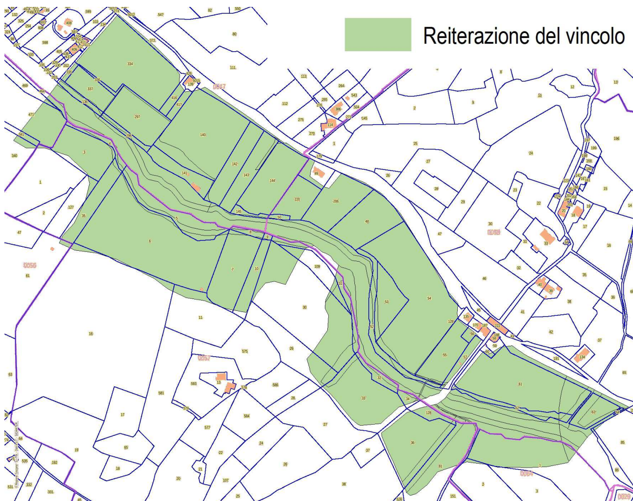
Estratto Catasto