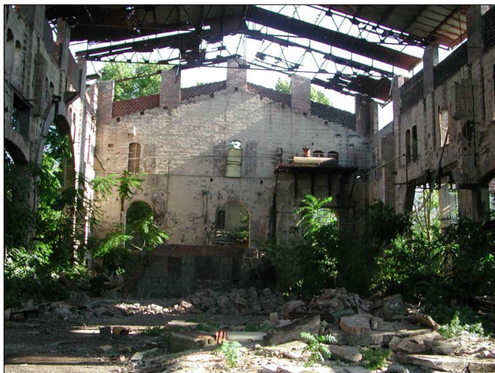
Foto 8 Interno reparto produzione