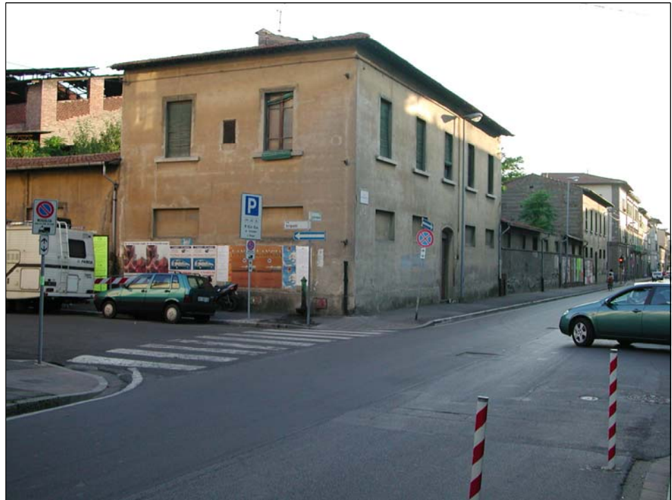
Foto 5 Angolo via G. da Empoli, Via Tripoli