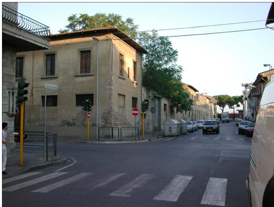
Foto 3 Angolo Via Curtatone e Montanara, Via G. da Empoli