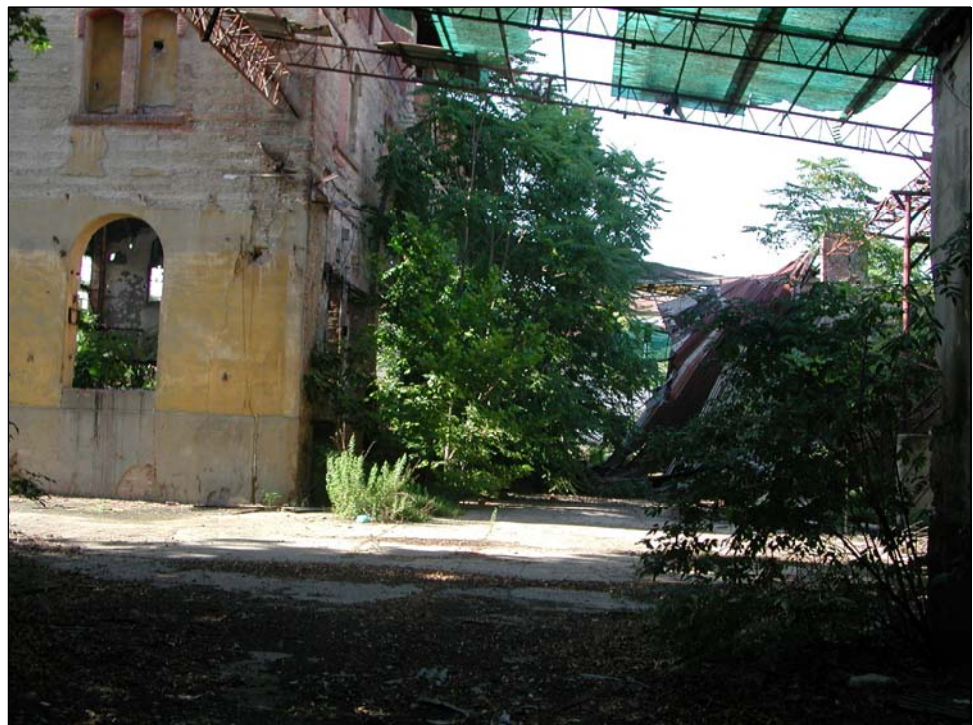
Foto 6 Corte interna lato ingresso