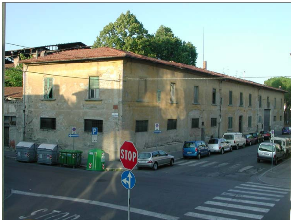
Foto 4 Angolo via Curtatone e Montanara, Via B. Ricasoli