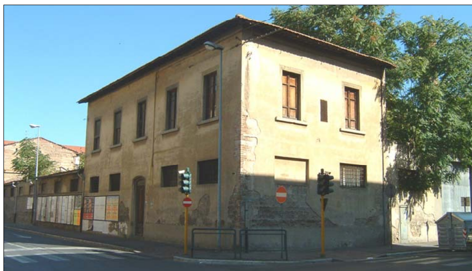
Foto 12 Angolo via G. da Empoli, via Curtatone e Montanara