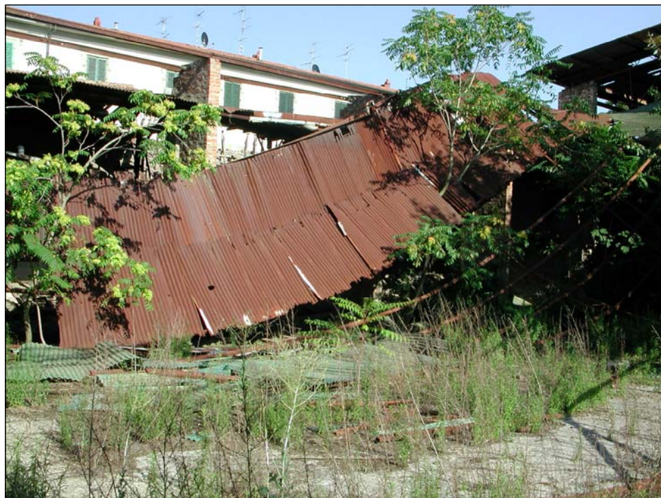
Foto 7 Corte interna lato via G. da Empoli