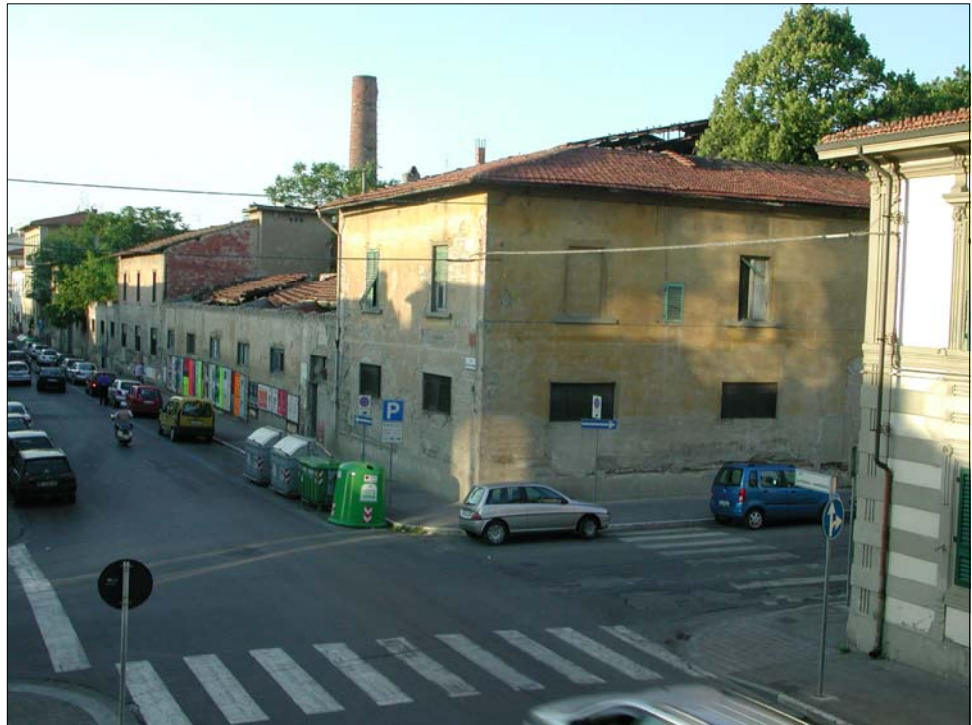
Foto 1 Angolo via Curtatone e Montanara, Via B. Ricasoli