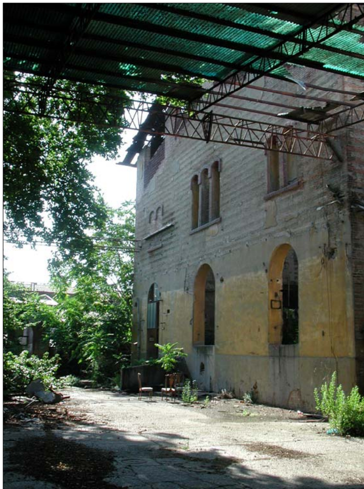
Foto 11 Corte interna lato ingresso