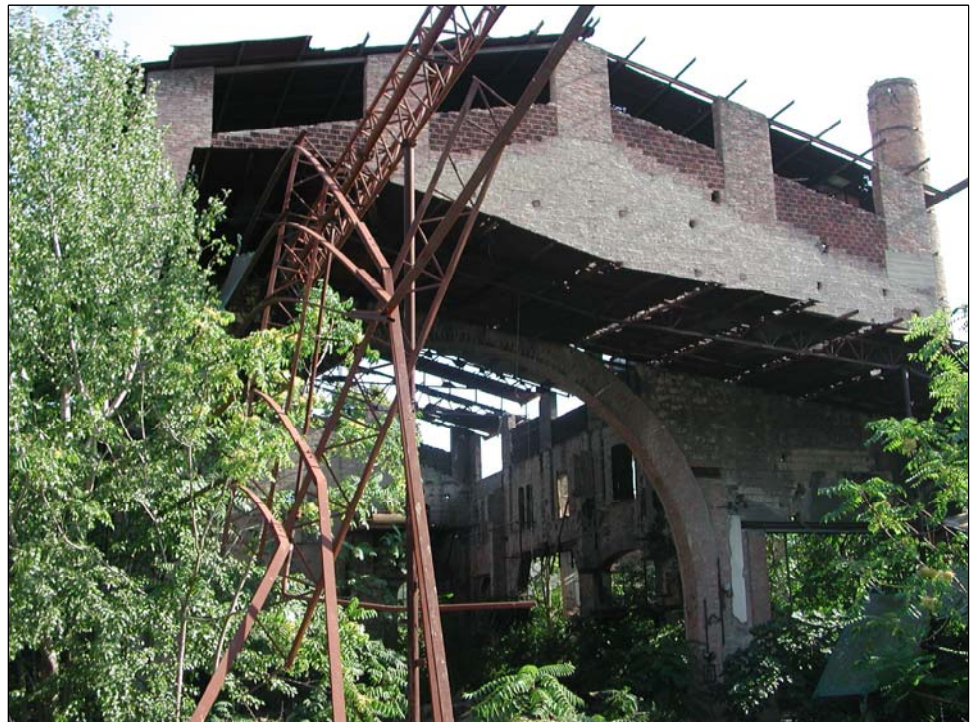
Foto 10 Prospetto reparto produzione