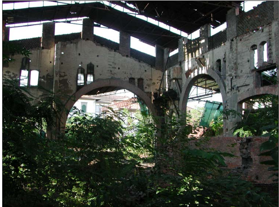
Foto 9 Interno reparto produzione