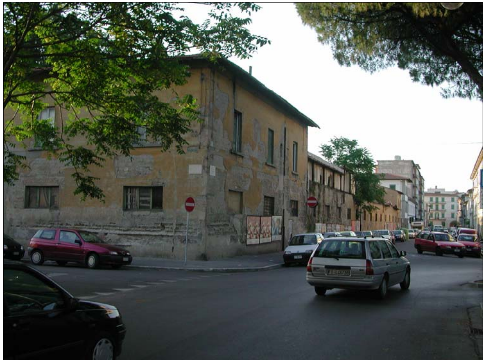
Foto 2 Angolo Via B. Ricasoli, Via Tripoli