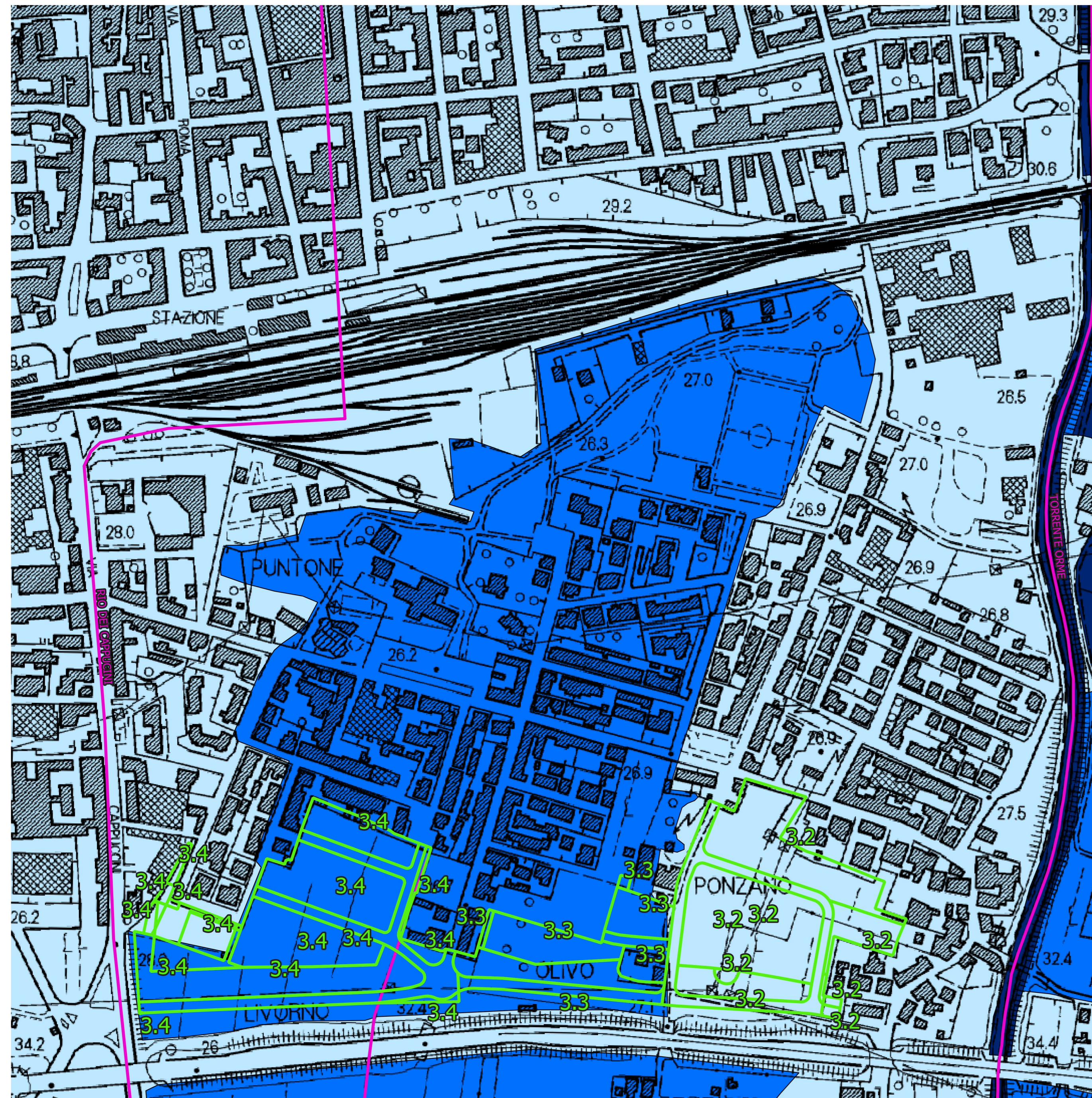
PGRA Stato Attuale