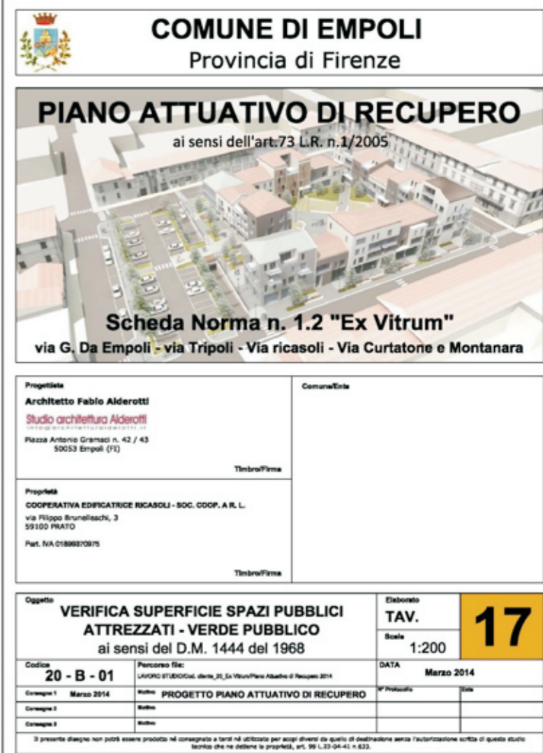
Planimetria di riferimento

Aree Spazi pubblici attrezzati/verde pubblico Area di proprietà