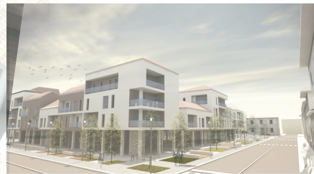
via Giovanni Da Empoli - via Curtatone e Montanara