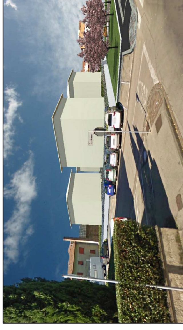
2 - VISTA DA VIA SAN MAMANTE INGRESSO VIA F. BOTTICINI