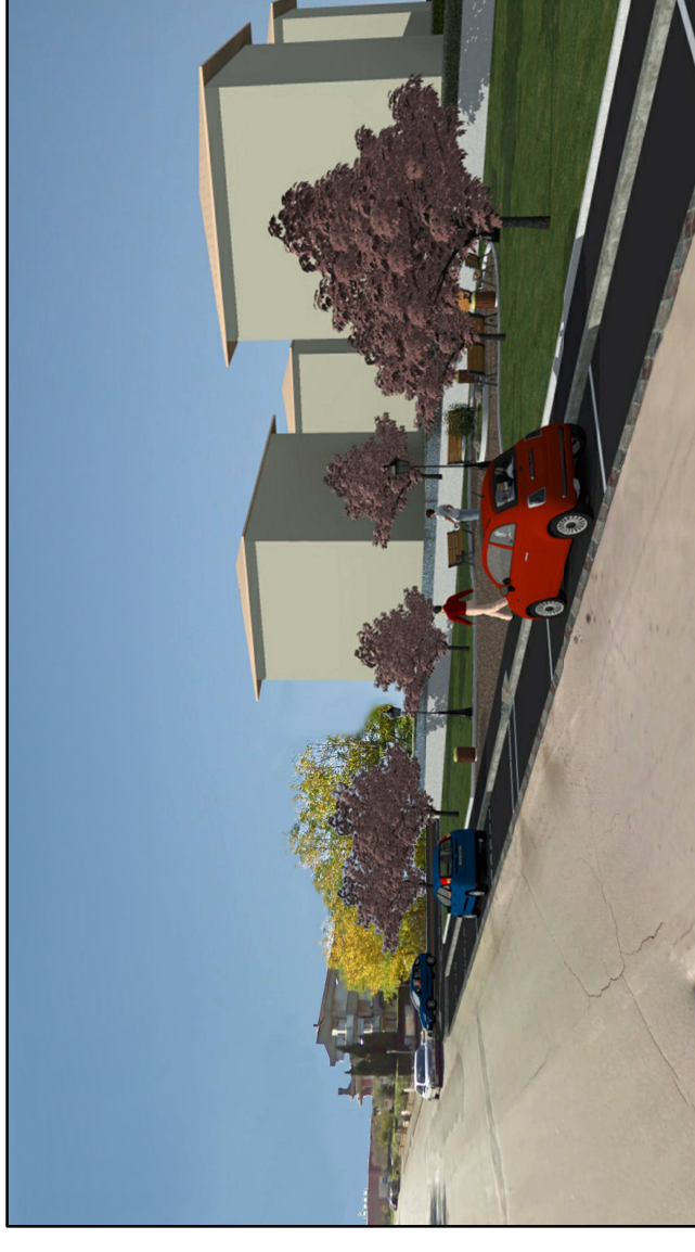
1 - VISTA DA VIA SAN MAMANTE