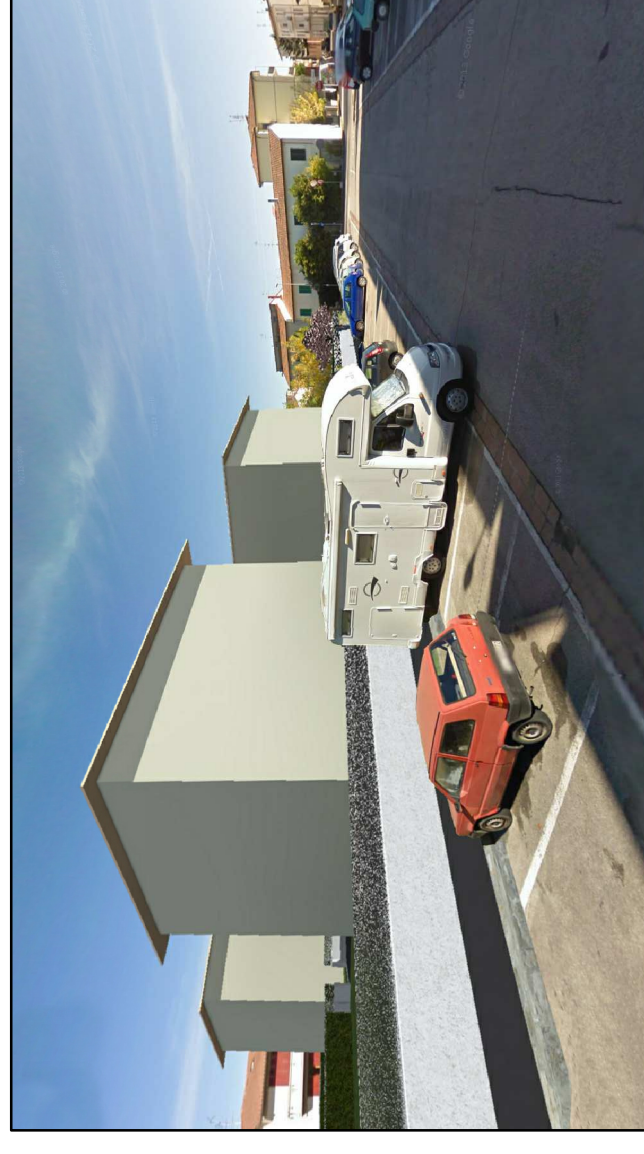
3 - VISTA DA VIA F. BOTTICINI