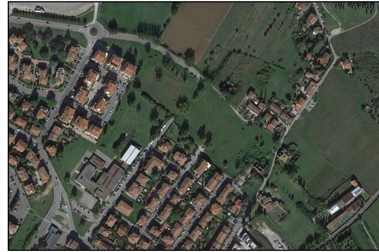
Vista aerea stato attuale

Scheda Norma per le aree soggette a Piano Attuativo n° 6.3 - Piano strutturale U.T.O.E. n°6 "La Città Nuova Progettata"