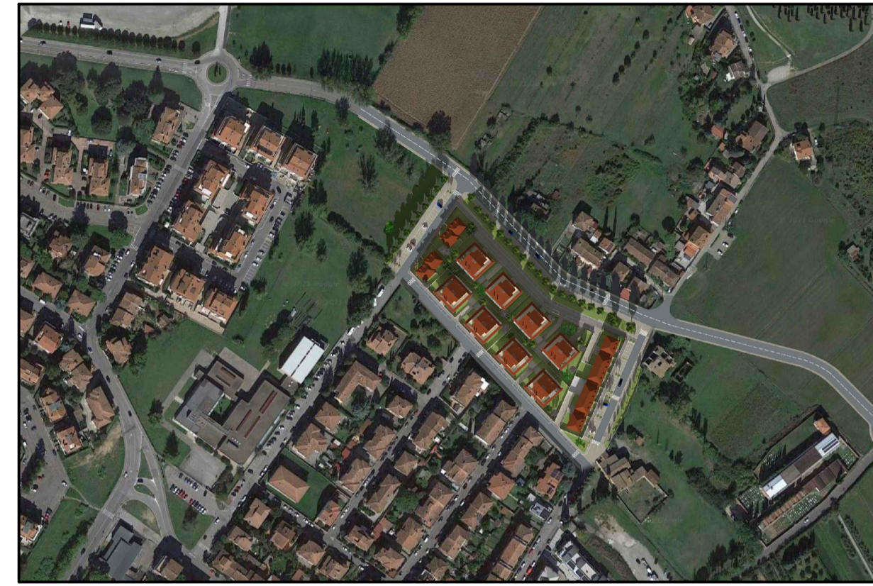
Vista aerea stato di progetto