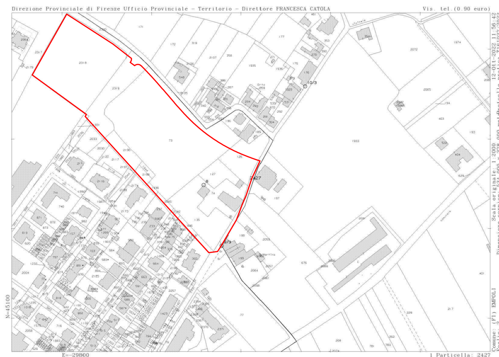
ESTRATTO DI MAPPA FOGLIO N°2