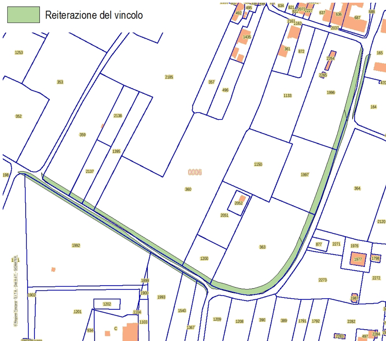
Estratto Catasto