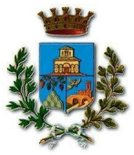
Estratto RU vigente