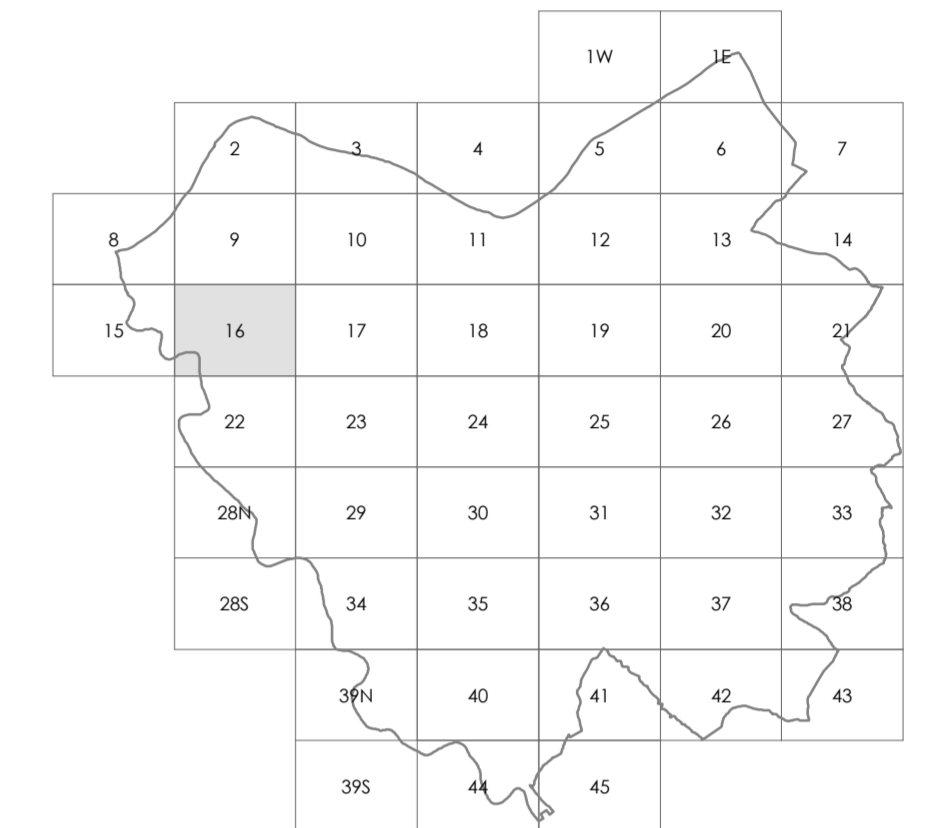
TAVOLA 1.16 SCALA 1:2.000