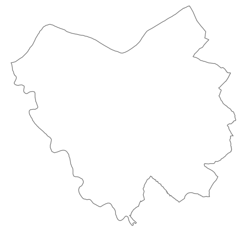
TAVOLA 1.52 SCALA 1:10.000