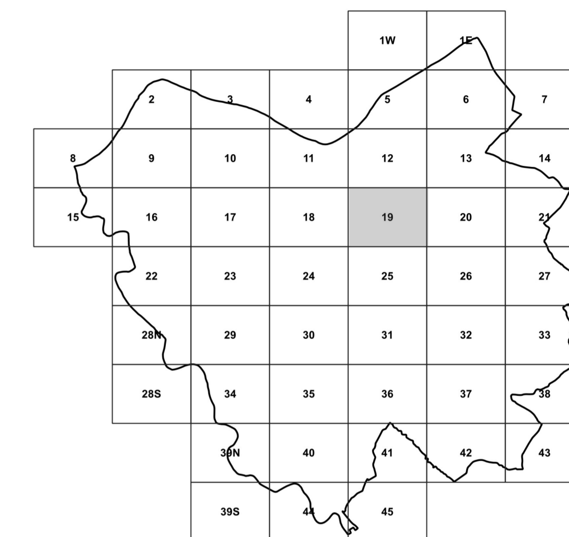
TAVOLA 1.19 SCALA 1:2.000