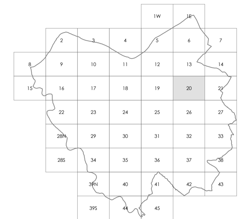
TAVOLA 1.20 SCALA 1:2.000