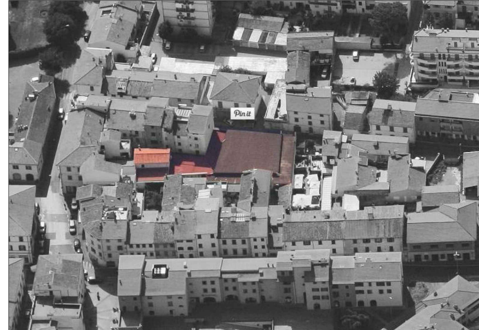
VISTA AEREA E INQUADRAMENTO AREA