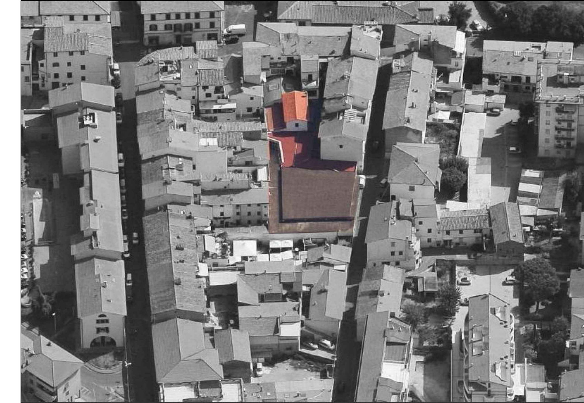
VISTA AEREA E INQUADRAMENTO AREA