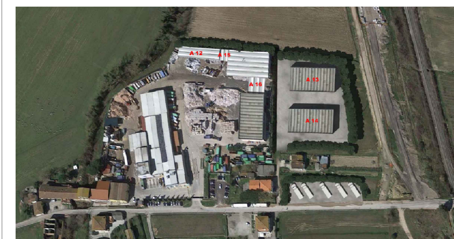
fotoinserimento edifici e tettoie in progetto