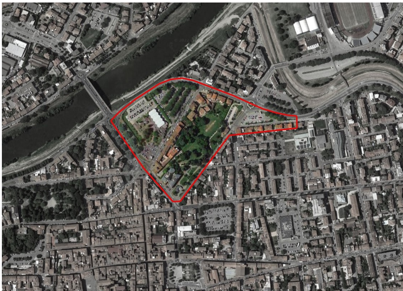
1- Area di intervento

L'intero progetto è stato guidato dal percorso partecipato "Teatro. Punto e a capo", promosso dal Comune di Empoli con il sostegno dell'Autorità regionale per la Garanzia e la Promozione della partecipazione della Toscana, un processo strutturato che sta coinvolgendo la comunità locale in eventi e iniziative finalizzate a raccogliere proposte e contributi per orientare la progettazione. I contributi sono stati raccolti e sintetizzati mediante interviste, tavoli di lavoro e incontri pubblici.