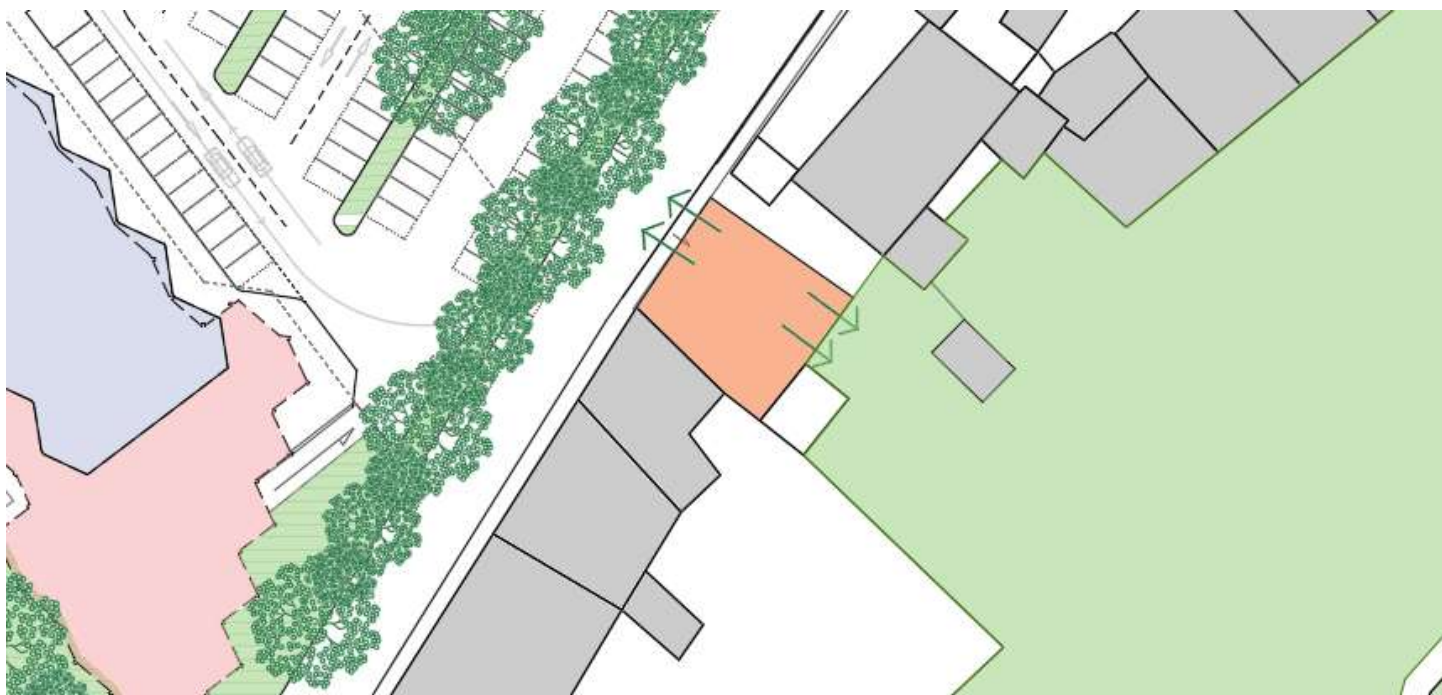
3 - Area in ipotesi di acquisizione