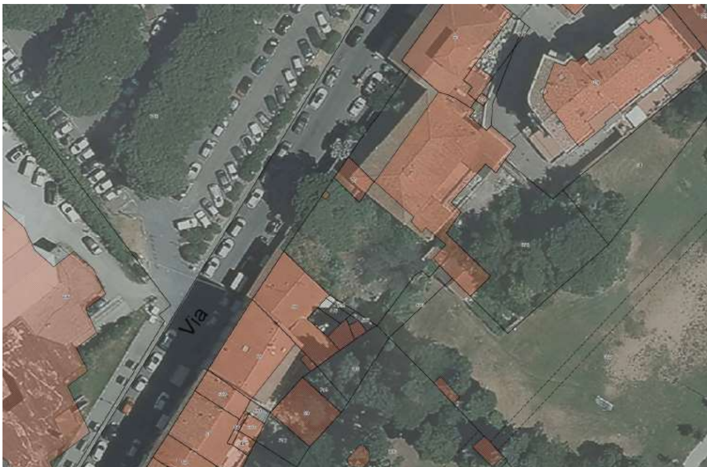
2 - Inquadramento con foto aerea