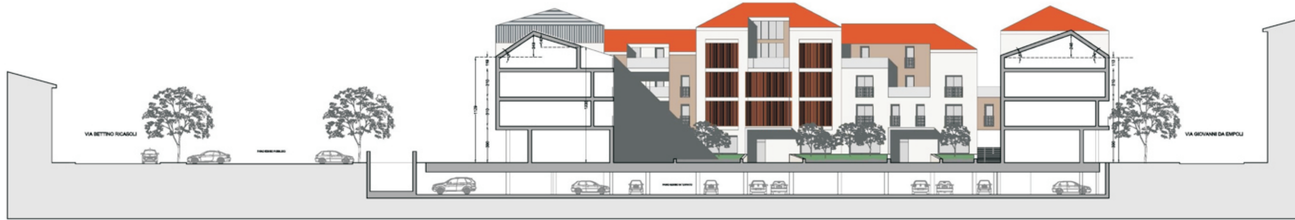
Prospetto P6 - P6' - via Curtatone e Montanara