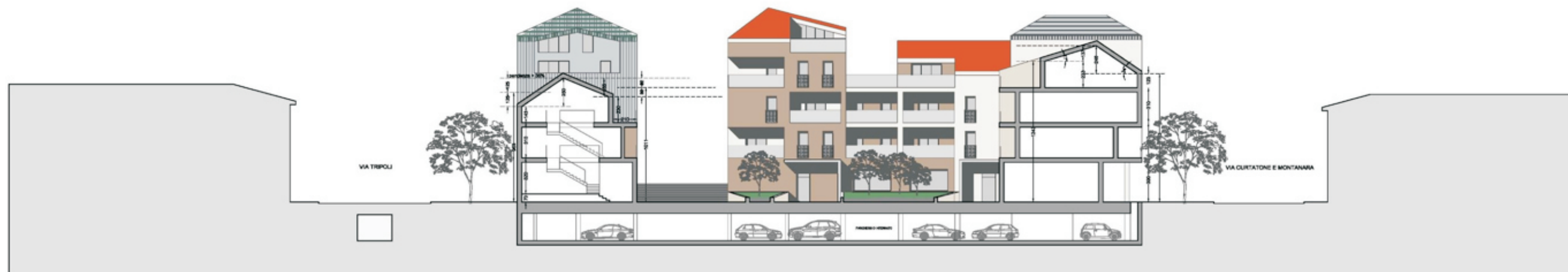
Prospetto P3 - P3' - via Bettino Ricasoli