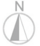
Planimetria di riferimento