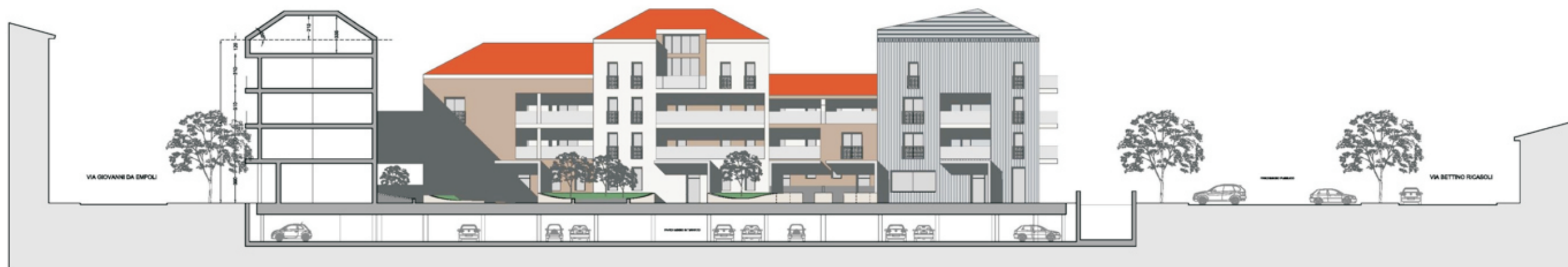
Prospetto P7 - P7' - via Tripoli