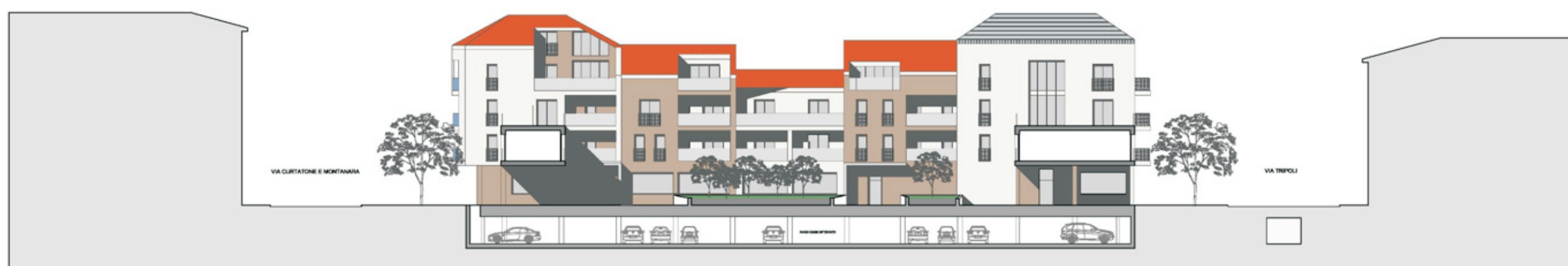
Prospetto P2 - P2' - via Giovanni Da Empoli