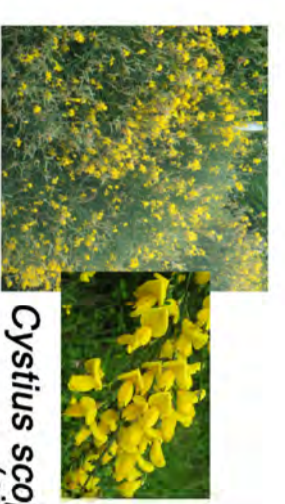
Cystisus scoparius (ginepro)