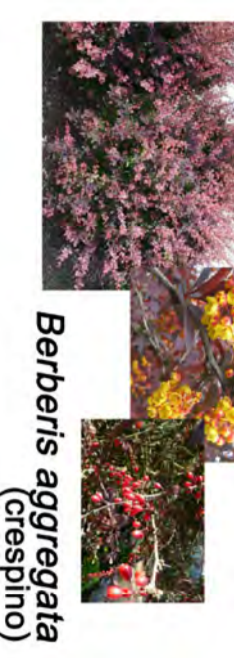
Berberis aggregata (crespino)