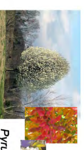
Pyrus calleryana (var. Chantidea)