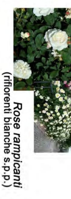
Rose rampancanti (fioroni bianche s.p.p.)