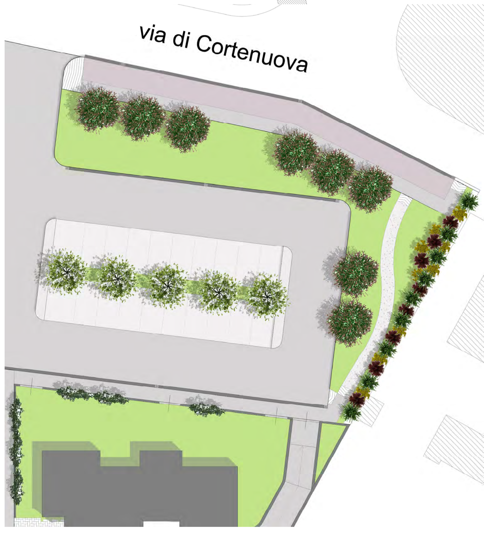
PARTICOLARE STATO DI PROGETTO