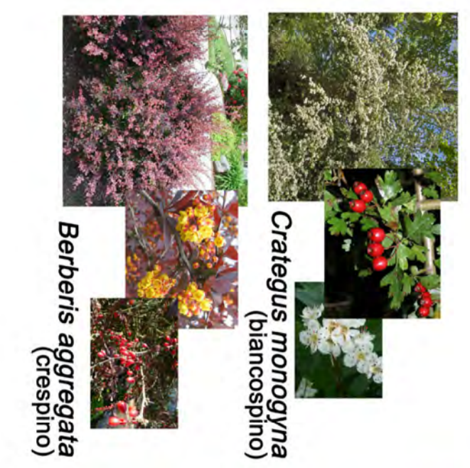
Crataegus monogyna (biancospino)